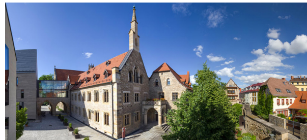
Augustinerkloster zu Erfurt